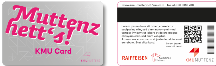
KMU Geschenkkarte (Design noch nicht final)

Die KMU Geschenkkarte ist eine Karte in Kreditkartenformat und wird wie eine EC-Karte eingesetzt.